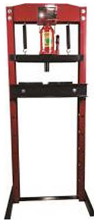
Υδραυλική Πρέσα 12T Kraft&Dele KD-328